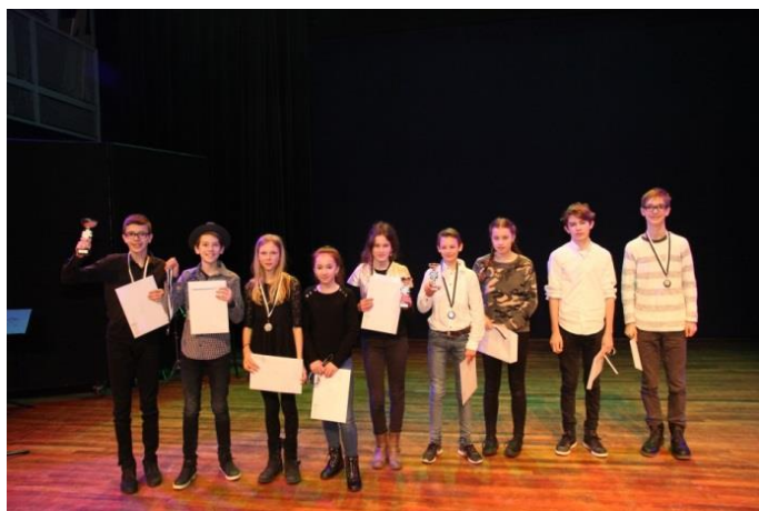
Jeugd en vierde divisie