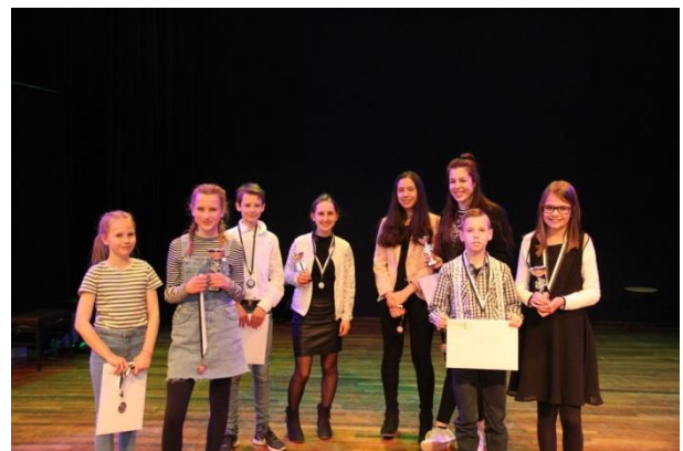
Kamermuziek afdeling jeugd en A

1e prijs: Sexteto Recuerdo plus lunchpauze concertprijs voor het Nationaal Accordeon Concours van 2019